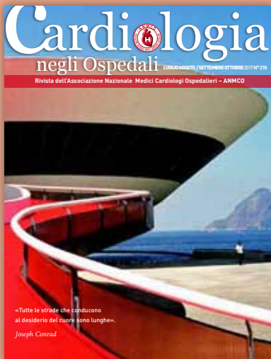
Museo d'Arte Contemporanea di Niterói o MAC, Oscar Niemeyer, 1996

N. 218 - 219 luglio/agosto settembre/ottobre 2017 Rivista ufficiale dell'Associazione Nazionale Medici Cardiologi Ospedalieri