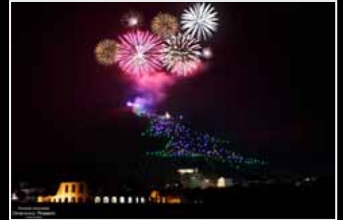
In 4° di copertina l'albero di Natale di Gubbio